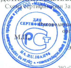
Схема сертификации За

Руководитель (заместитель руководителя) органа по сертификации